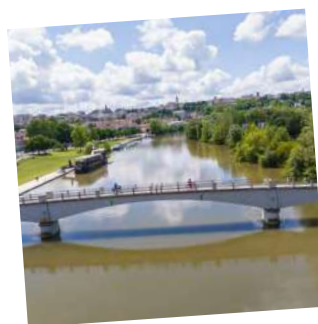
4. Angoulême, capitale de la BD