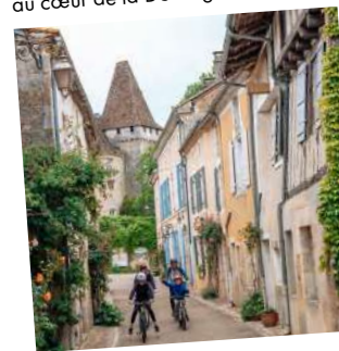
3. Saint-Jean-de-Côle et son patrimoine