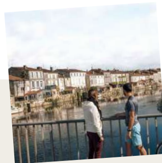
7. Saint-Savinien-sur-Charente, classée « Ville et Métiers d'Art »