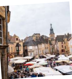
1. Sarlat-la Canéda au cœur de la Dordogne