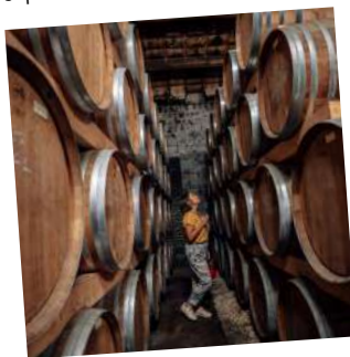
6. Cognac et son vignoble