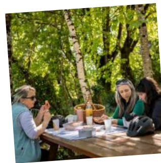
5. La coulée d'Oc et sa nature luxuriante