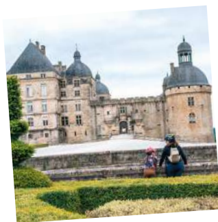
2. Hautefort et son château