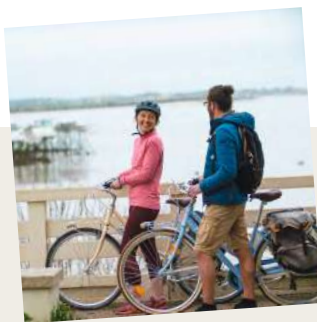
8. Fouras-les-bains, la presqu'île de Charente.